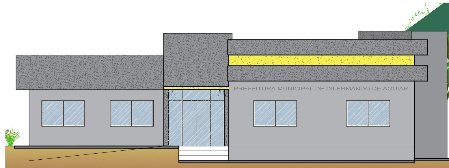
FACHADA FRONTAL Escala 1/100